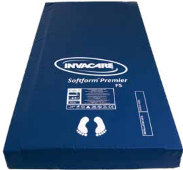
Softform Premier FS (med helsveiset trekk)

Invacare Softform Premier er en antidecubitusmadrass som er utviklet for å oppnå god trykkfordeling og komfort. Under utformingen av Softform Premier er det lagt spesielt vekt på trykkreduisering ved hælene. En praktisk og holdbar madrass som tilpasser seg godt sengens innstillinger.